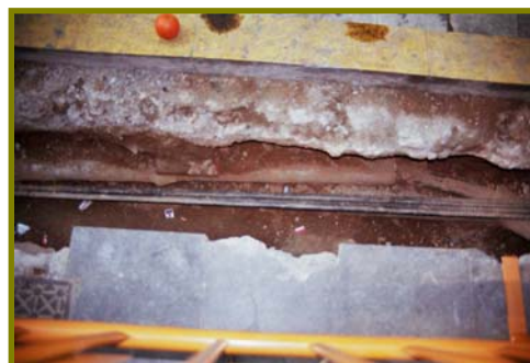
Il·lustració 3: Detall de la rasa.

seqüència estratigràfica, totalment mancada d'interès arqueològic. Podem dir doncs, que no s'han documentat restes arqueològiques ja que la zona havia estat oberta amb anterioritat, reomplint la totalitat de la rasa amb sauló (U.E 103).