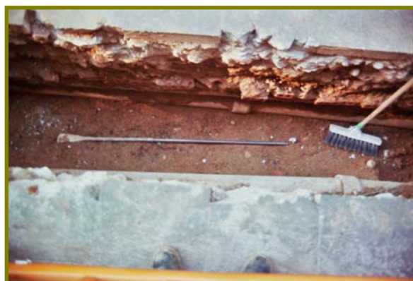
Il·lustració Vista general de l'obertura de la Rasa.