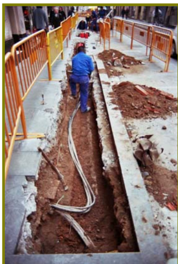
Il·lustració 6: Obrers treballant en l'obertura de la Rasa.