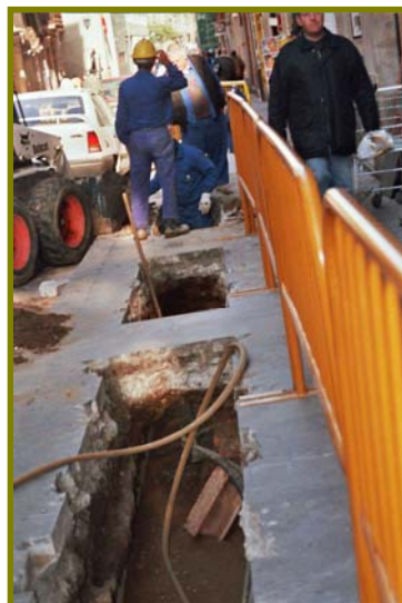
Il·lustració 5: Obertura de la Rasa.