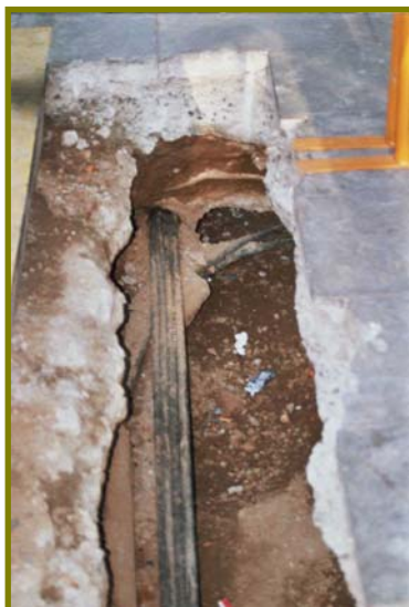
Il·lustració 4: Vista general de l'obertura de la Rasa.