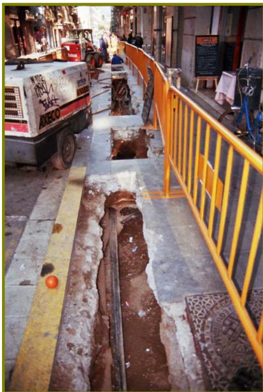
Il·lustració 2: Vista general de l'obertura de la rasa .

seqüència estratigràfica, totalment mancada d'interès arqueològic. Podem dir doncs, que no s'han documentat restes arqueològiques ja que la zona havia estat oberta amb anterioritat, reomplint la totalitat de la rasa amb sauló (U.E 103).